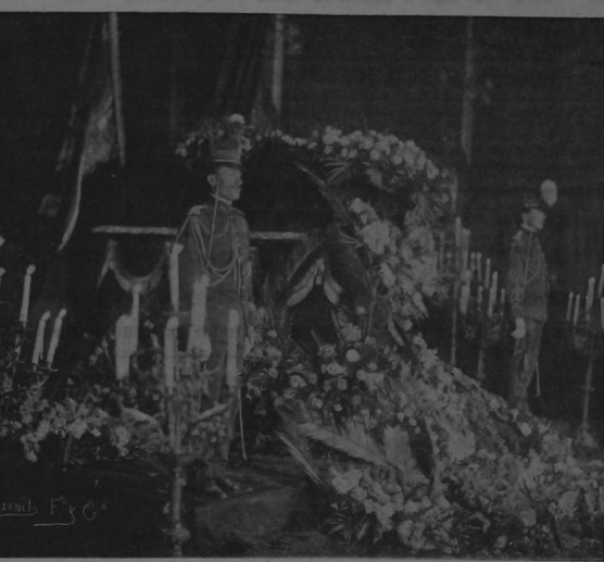
La capilla ardiente en el Salón de sesiones del Congreso