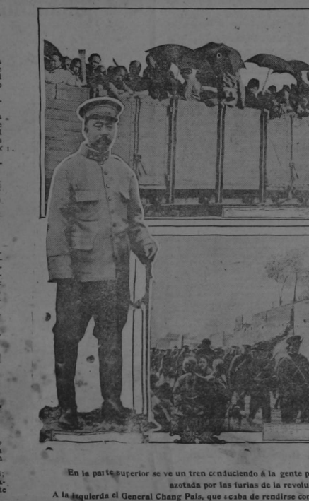
En la parte superior se ve un tren conduciendo a la gente pacífica que huye de Hankow, azotada por las furias de la revolución. A la izquierda el General Chang Pais, que acaba de rendirse con diez mil soldados, a la revolución. En la parte inferior se ven las tropas rebeldes en Wuchang.